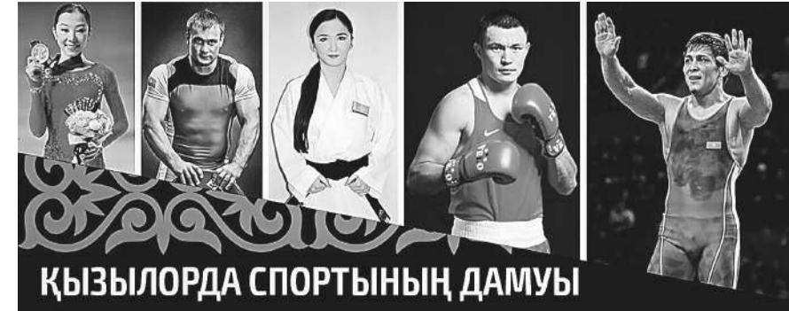
ҚЫЗЫЛОРДА СПОРТЫНЫҢ ДАМУЫ

Спорт түрлерінен әлем, Азия және Қазақстан Республикасының чемпионаттарына спортшылардың (оның ішінде мүмкіндігі шектеулі) дайындығы мен қатысуын қамтамасыз ету және барынша жүлделі орындар алуына жағдай жасау үшін еңбек ететін боламыз.