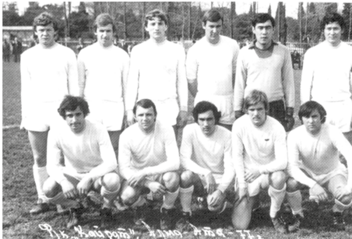
Знаменитый футболист тренировал три сборные Казахстана: олимпийскую (1995-96), сборную клубов Казахстана (1997) и национальную (1998).