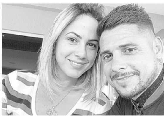
«Бірге жаттығудан қалай бас тартасың?» – деп жазды Сисиньо.

Бразилиялықтың ойын деңгейі «Реалға» сай келді. Бірақ іштей топ-клубқа дайын емес еді. Мадридте қысым көп. Ол жағы айтпаса да түсінікті. Медианың назары, көп ақша, селебрити-достар бар. Бірақ ол үшін бірінші кезекте көңіл көтеру мен алкоголь тұрды.